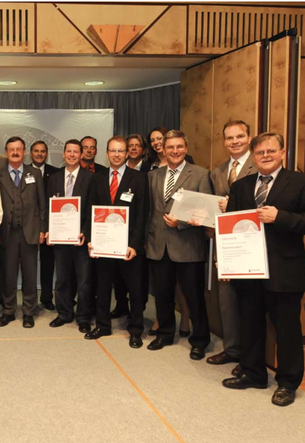
Preisträger der Wettbewerbsrunde 2010